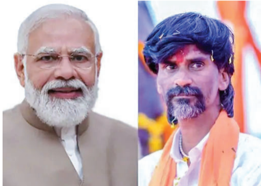
सरकारला दिले मराठवाडा गॅझेट