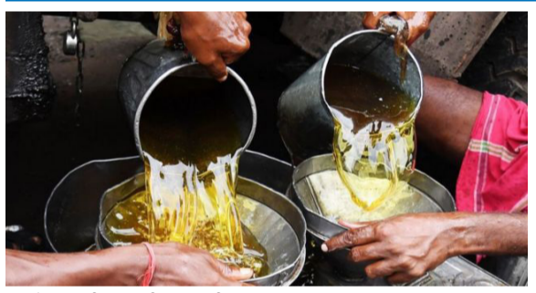
क्रमांकाचा देश आहे. खाद्यतेलाच्या आयातीत जगात भारत पहिल्या क्रमांकावर आहे. देशाच्या एकूण गरजेच्या साठ टक्के वाटा आयात

तेलाचा आहे. इंडोनेशिया आणि मलेशियामधून पाम तेल आयात करण्यात येते. सोयाबीन, मोहरी आणि सूर्यफुल यांच्या तेलाचा भारतात सर्वाधिक वापर होतो.