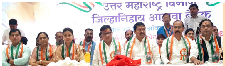
काँग्रेस जनतेच्या उद्रेकासोबत

विद्यमान ट्रिपल इंजिन सरकारने महाराष्ट्राची परिस्थिती अत्यंत दयनीय करून टाकली आहे. राज्यातल्या सचब प्रमुख रस्त्यांवर खड्ड्यांचे साम्राज्य झाले आहे, गाडी चालवणे आणि प्रवास करणे, हे जीवावर बेतणारे आहे. रस्त्यावरचा प्रत्येक खड्डा महायुती सरकारच्या नाकतेंपणाची साक्ष देतो, रस्त्यावर असणारे खड्डे आणि त्यावर जर मार्गच काढायचा नसेल तर टोल