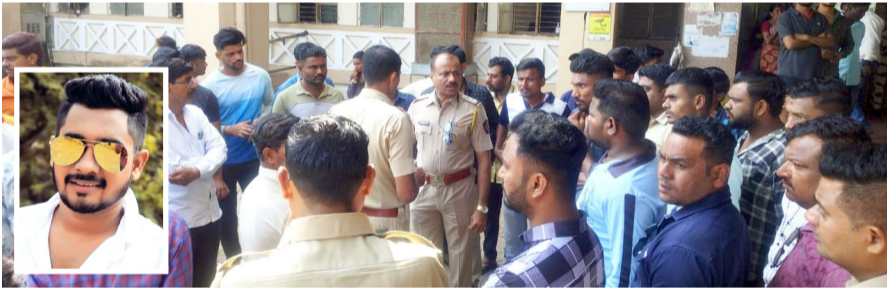
खुनाचा गुन्हा दाखल