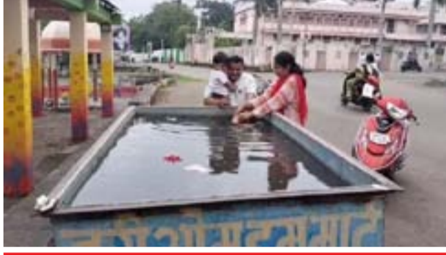
पालिका प्रशासनाला सहकार्य करावे

गणपती उत्सवामुळे सर्वत्र चैतन्याचे वातावरण आहे. घरघरी प्रमाणे छोटेखानी चाळीत, अपार्टमेंटमध्येही गणपतीची स्थापना करण्यात आली आहे. या गणपतीचे आता टप्प्याने विसर्जनही सुरु झाले आहे. त्याप्रमाणे पाचव्या दिवशी घरगुती गणपतीचे मोठ्या प्रमाणात विसर्जन नदी पात्रात करण्यात आले आहे. त्यानंतरचा टप्पा म्हणजे सातव्या दिवशी होय. पांझरा नदीपात्रात महापालिका प्रशासनातर्फे ९ ठिकाणी विसर्जन स्थळांची व्यवस्था करण्यात आली आहे. त्याठिकाणी सर्व प्रकारची सुविधा देण्यात आली