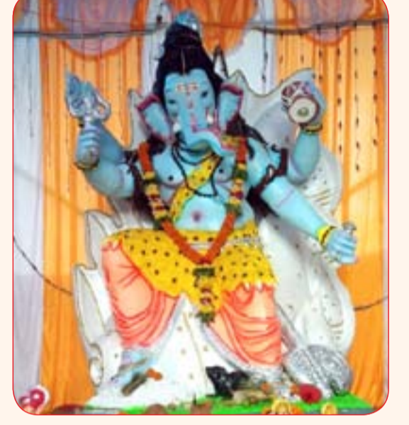
क्रांती चौक मित्र मंडळ