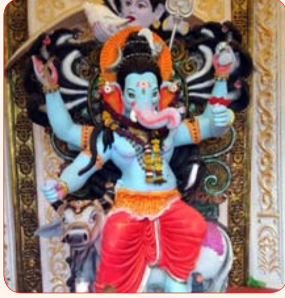
सूर्यमुखी मारुती मित्र मंडळ, सत्यविजय मित्र मंडळ