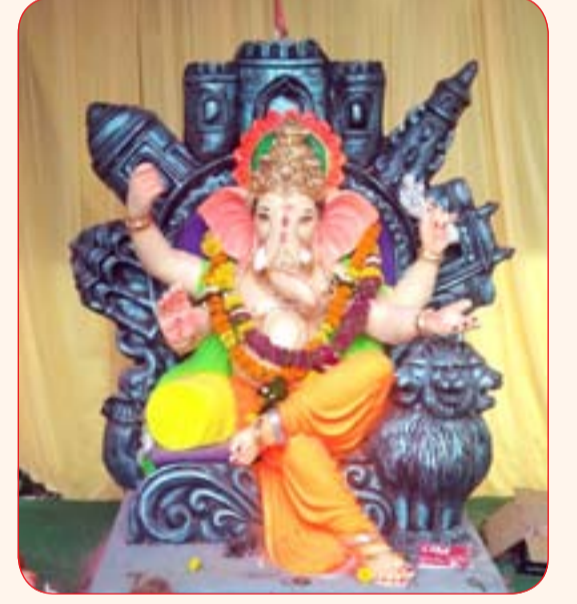
राजगुरु मित्र मंडळ