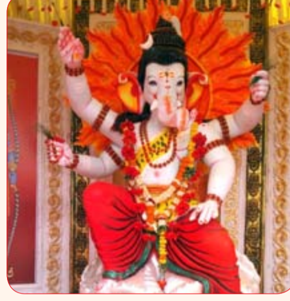
साई गणेश मित्र मंडळ