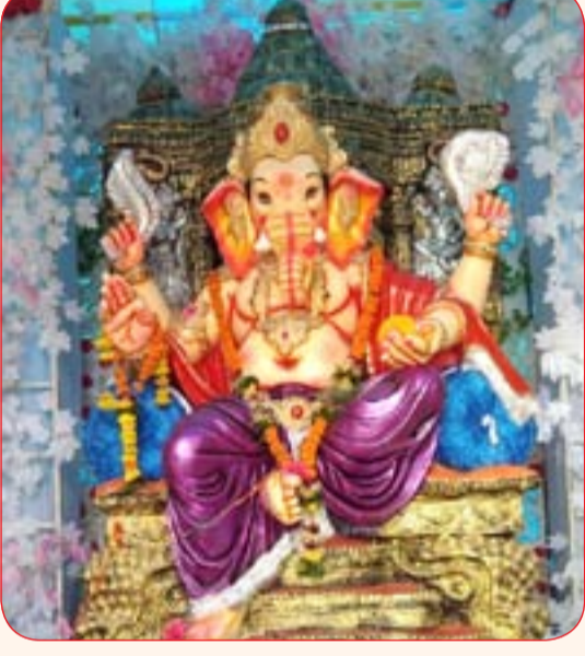
स्वराज्य ग्रुप प्रतिष्ठान

मंडळांकडून धार्मिक आणि सांस्कृतिक कार्यक्रमांचे आयोजन