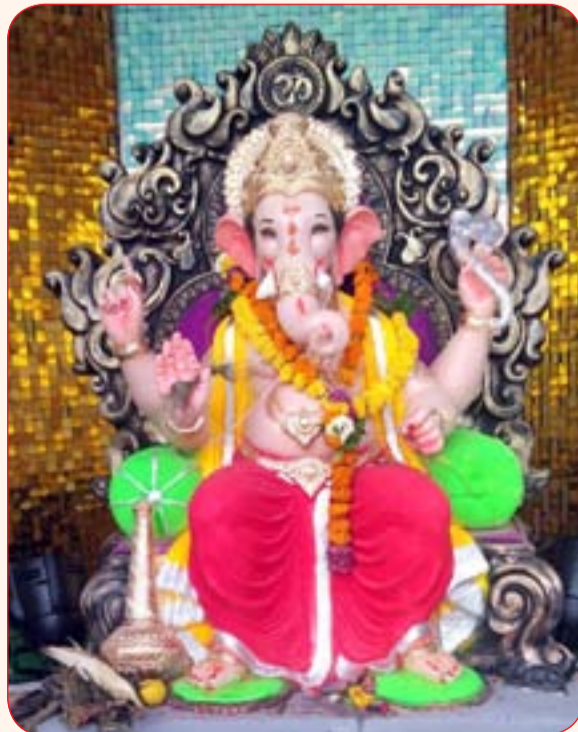
जय बजरंग मित्र मंडळ