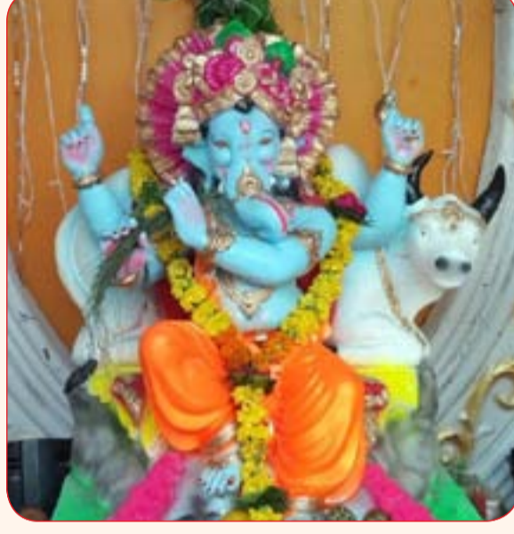
दत्त नगर मित्र मंडळ