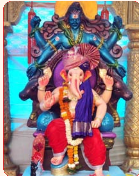
मोरया मित्र मंडळ