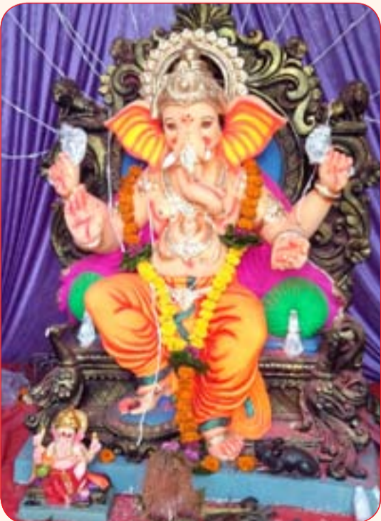
तरुण मित्र मंडळ