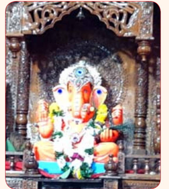
हिंदू एकता उत्सव समिती