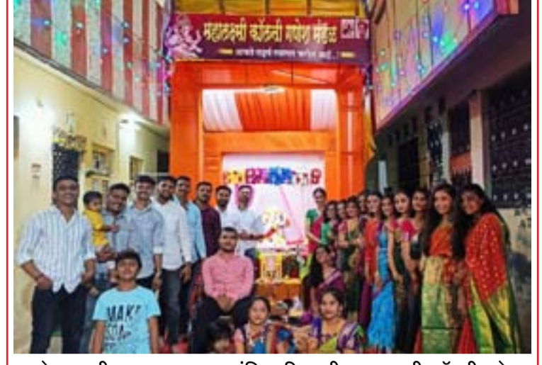
धुळे शहरातील जलाराम बाप्पा मंदिर परिसरातील महालक्ष्मी कॉलनी गणेश मंडळाचा गणपती व परिसरातील नागरिक उपस्थित होते.