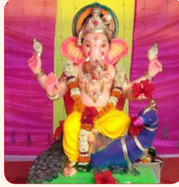
राजे शिवराय मित्र मंडळ