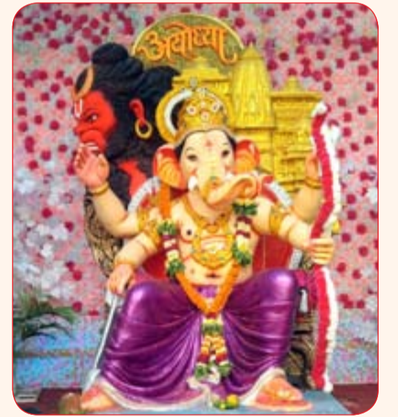
हिंदवी मित्र मंडळ