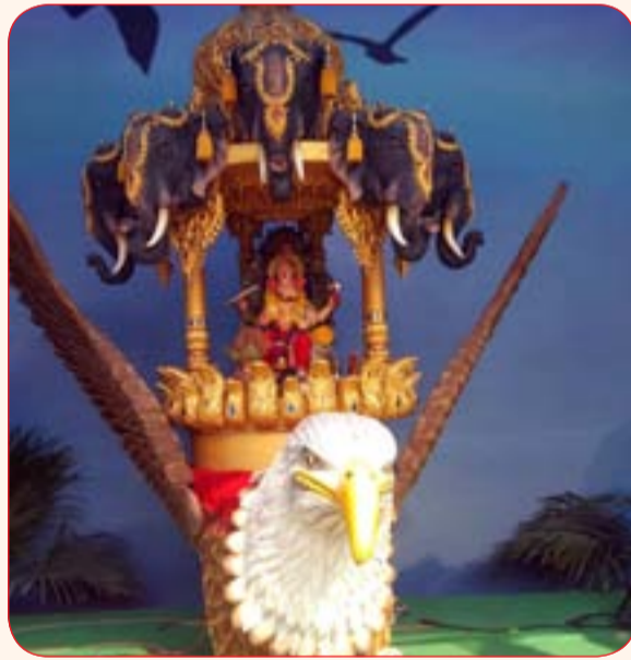
जय शिवराय मित्र मंडळ