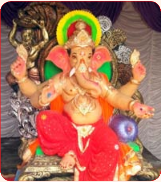
बाल गोपाल मित्र मंडळ