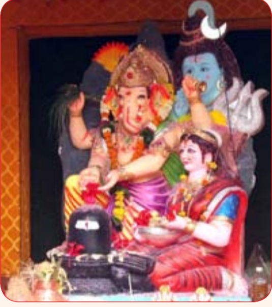
रामनगर मित्र मंडळ