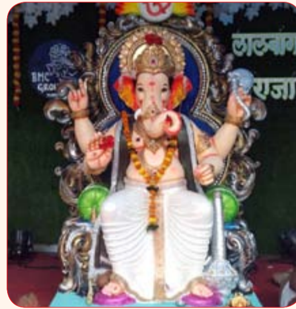
भटाई माता चौक मित्र मंडळ