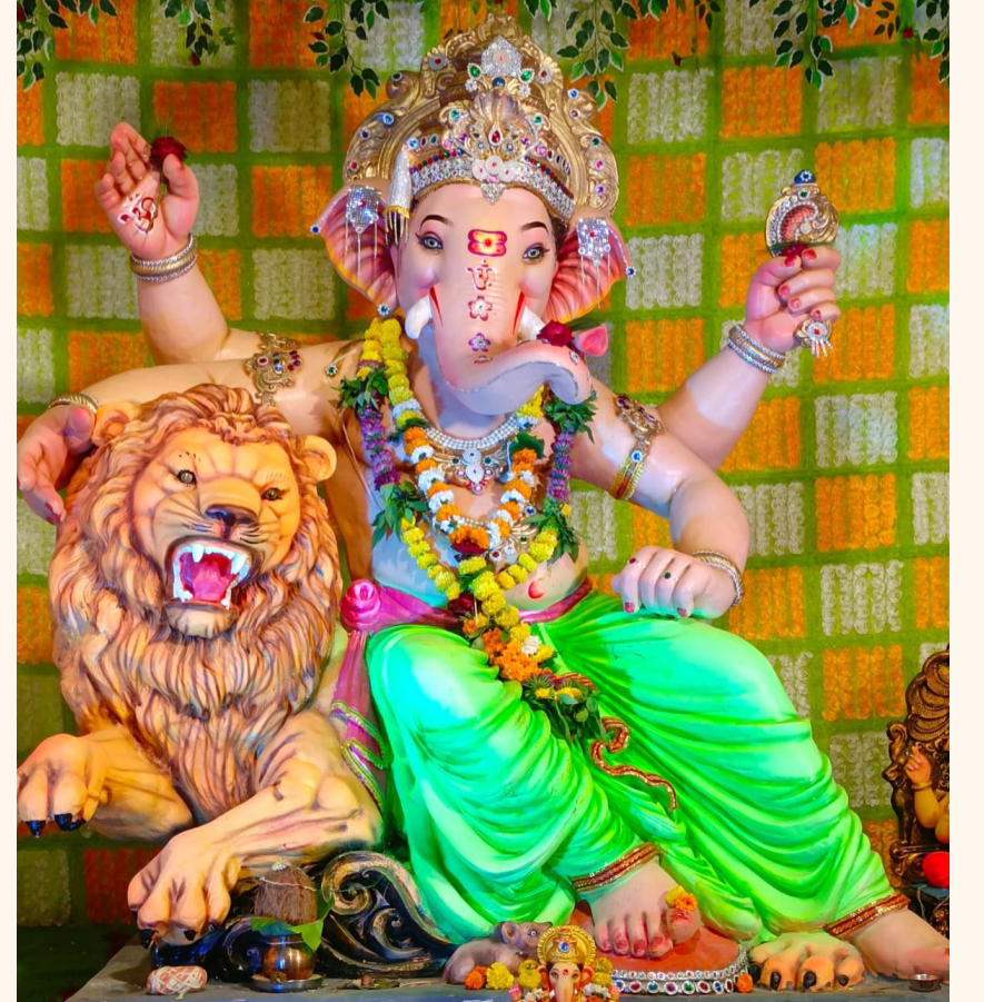
युवा सांस्कृतिक मित्र मंडळ