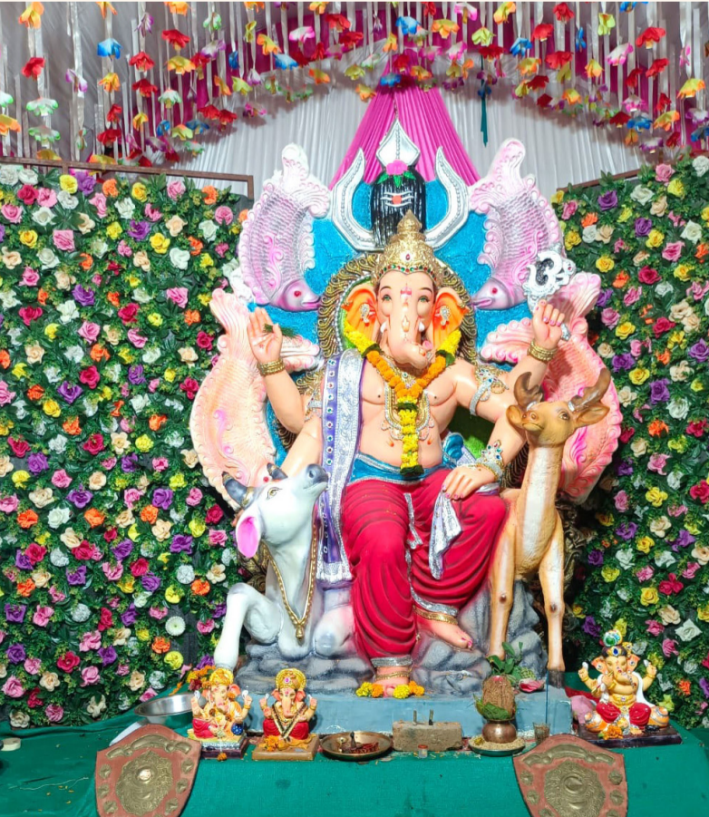
गुरु गोविंद मित्र मंडळ