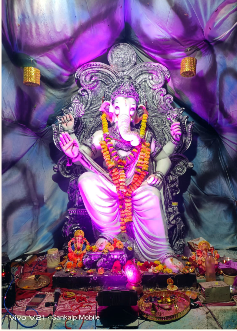
पवनपुत्र गणेश मित्र मंडळ