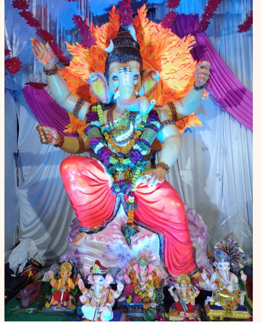
विघ्नहर्ता गणेश मित्र मंडळ