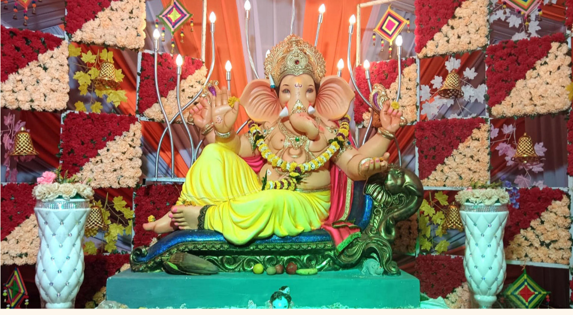
श्री.शिवशक्ती गणेश मित्र मंडळ सोनगीर

सार्वजनिक गणेश मंडळांनी केली आकर्षक गणपती मूर्तीची स्थापना