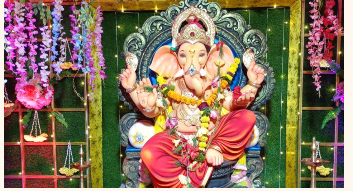
श्री.कृपा गणेश मित्र मंडळ