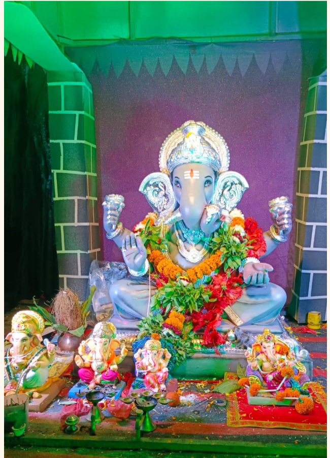
संत सावता मित्र मंडळ