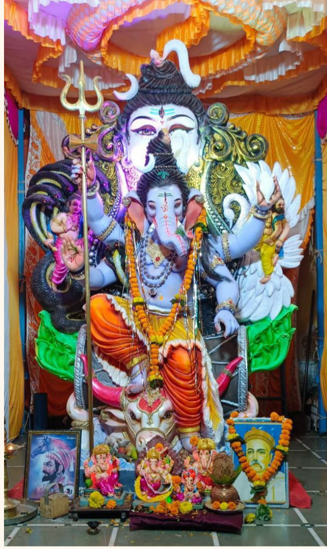
हेंब गणेश मित्र मंडळ