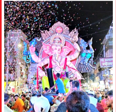
विघ्नहर्ता गणरायाचे आगमन १९ सप्टेंबरला होणार आहे. आगमनाला अद्याप एक दिवस शिल्लक आहे. त्यापूर्वीच पेट विभागाचा महाराजा मरिमाता गुपतफे गणरायाच्या आकर्षक मूर्तीची शहरातून सवाद्य जल्लोषात मिरवणूक काढण्यात आली.