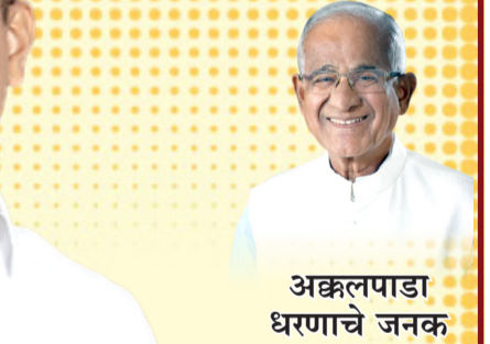
अक्कलपाडा धरणाचे जनक