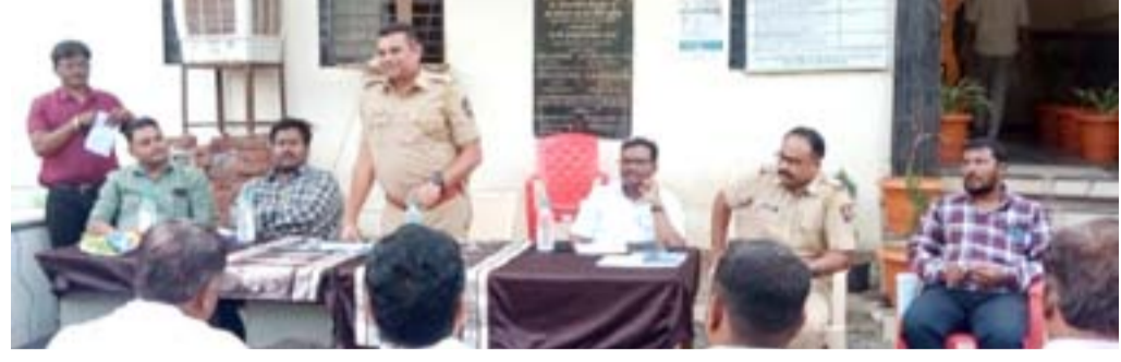
शिंदखेडा । प्रतिनिधी

गौरी गणेशाचे आगमन व ईद निमित्त शिंदखेडा पोलीस ठाणे येथे शांतता समितीची बैठक संपन्न झाली.