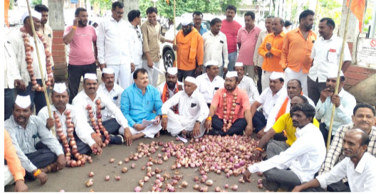
निर्यात रद्दची केली मागणी

जिल्हाधिकारी कार्यालया समोरच कांदा फेक करीत जोरदार घोषणाबाजी करण्यात आली. यावेळी कांद्याच्या माळा गळ्यात घालून सरकारचा निषेधही करण्यात आला. जिल्हाधिकारी कार्यालयासमोर करण्यात आलेल्या या आंदोलनाचे सार्वांचे लक्ष वेधून घेतले होते. एप्रिल ते जुलै महिन्याच्या कालावधीत ५० टक्के पेक्षा अधिक कांदा सडल्याने उकीरड्यावर फेकण्याची वेळ शेतकऱ्यांवर आली होती. गेल्या चार ते पाच वर्षांपासून ८०० ते १ हजार रूपयांपेक्षा अधिक भाव कांदा उत्पादक शेतकऱ्यांना मिळालेला नाही. कांदा भाव वाढीस सुरुवात झाल्याबरोबर केंद्र सरकारने ४० टक्के निर्यात शुल्क लावले आहे. केंद्र सरकारचे हे धोरण अन्यायकारक असून यामुळे सामान्य शेतकऱ्यांचे जगणे मुश्किल झाले आहे. त्यामुळे